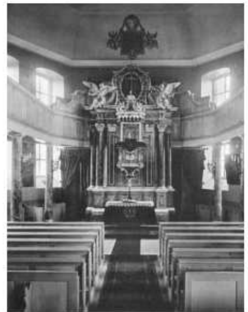
Nach der Renovierung 1896